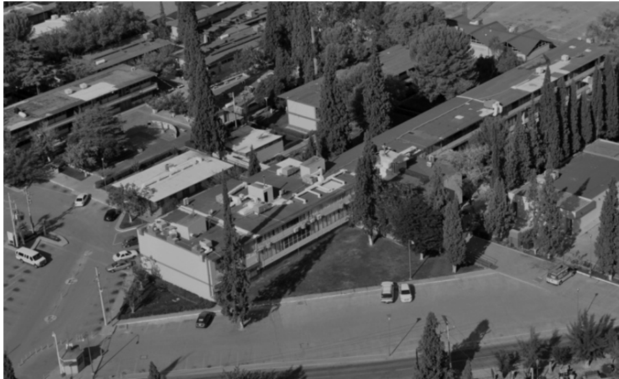
Figura 3. Instalaciones antiguas tipo CAPFCE de la Facultad de Ingeniería

La infraestructura de la Facultad se ha ido actualizando, en la Figura 3 se plasman las instalaciones antiguas ubicadas en el campus 1, estas no fueron suficientes para la actualización de equipo en laboratorios, aumento de aulas e instalaciones administrativas. En el 2006 se trasladó a un nuevo campus, en la Figura 4 se puede observar el cambio respecto a las instalaciones antiguas. Donde se cuenta con un edificio de tres niveles que alberga los laboratorios (Topografía, sanitaria, geología, química, computación, hidráulica, materiales, asfaltos, fotogrametría, física y automatización). Instalaciones para posgrado, dos edificios para aulas de licenciatura, un inmueble de tres niveles para cubículos de profesores, un módulo para área administrativa, un edificio para biblioteca, una construcción para cafetería e instalaciones deportivas.