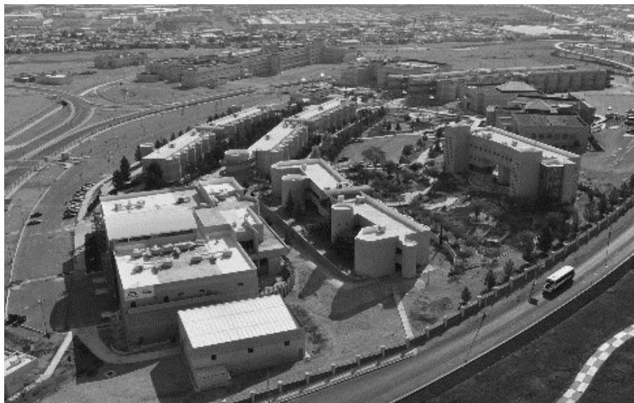
Figura 4. Instalaciones nuevas de la Facultad de Ingeniería