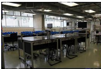
Figura 2. Grupo de trabajo con propósito dedicado

Grupos de trabajo con propósito dedicado. Estos equipos pueden simular entornos productivos reales, tales como líneas productivas, línea de ensamble con las herramientas más comunes (7 herramientas estadísticas, manufactura esbelta, Diseño de Experimentos, Six Sigma, etc.). La Figura 2 muestra los equipos de esta sección.