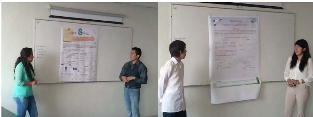
Figura 3. Estudiantes exponiendo proyecto de clase en inglés

Las exposiciones en idioma inglés han sido una práctica que genera resultados satisfactorios para el estudiante y el docente, debido a que la exigencia y dedicación para estos trabajos en otro idioma, les permite desarrollar las competencias que los guiará a mejorar su desempeño académico y profesional. En la figura 3 se observan dos ejemplos de ello.