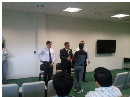
Figura 2. Entrega de reconocimientos por parte del Director General a estudiantes de ISC en talleres de programación

Los autores de este trabajo han puesto en práctica una actividad que a la fecha ha reportado muy buenos resultados con los estudiantes que participaron en el estudio. Las clases son impartidas en idioma español de manera general, y se han agregado periodos en los cuales todas las actividades de clase, extraclase y socialización, deben ser expresados únicamente en el idioma inglés. Esto obliga a los estudiantes a utilizar sus habilidades de aprendizaje y expresión en un segundo idioma.