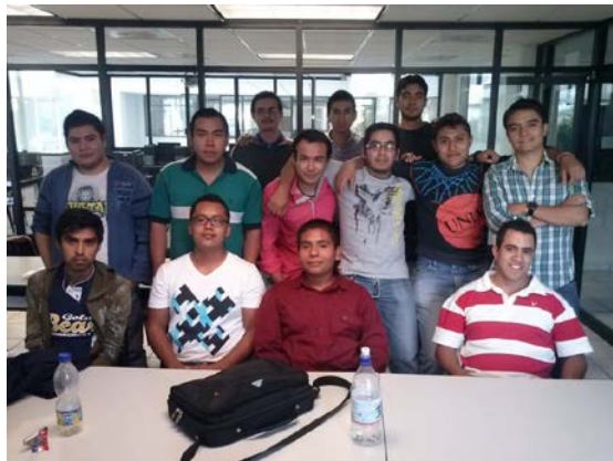
Figura 4. Grupo de estudiantes como caso de estudio

Con el trabajo realizado se han obtenido algunos productos, entre los cuales se mencionan los siguientes: