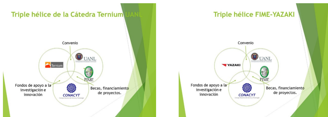
Figura 2. Modelos de la triple hélice para el caso de la Cátedra Ternium-UANL (izquierda) y el caso FIME-Yazaki (derecha).

Estos dos ejemplos, Figura 2, tienen en común que implican proyectos y situaciones reales, una fase exploratoria, la participación de estudiantes (de licenciatura, posgrado e incluso de nivel medio superior), estancias en la industria, convenios formales y publicaciones.