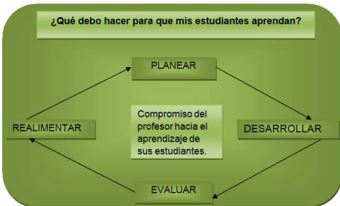
Figura 2. Círculo virtuoso de la planeación-evaluación

En resumen, el profesor debe crear un círculo virtuoso de la planeación destacando cuatro fases esenciales, partiendo de la planeación semestral, el desarrollo de las actividades preestablecidas, la evaluación y la realimentación a los estudiantes de sus actividades académicas y en función de esa realimentación replantear las siguientes actividades a desarrollar por el grupo de estudiantes y profesor, como se muestra en la Figura 2.