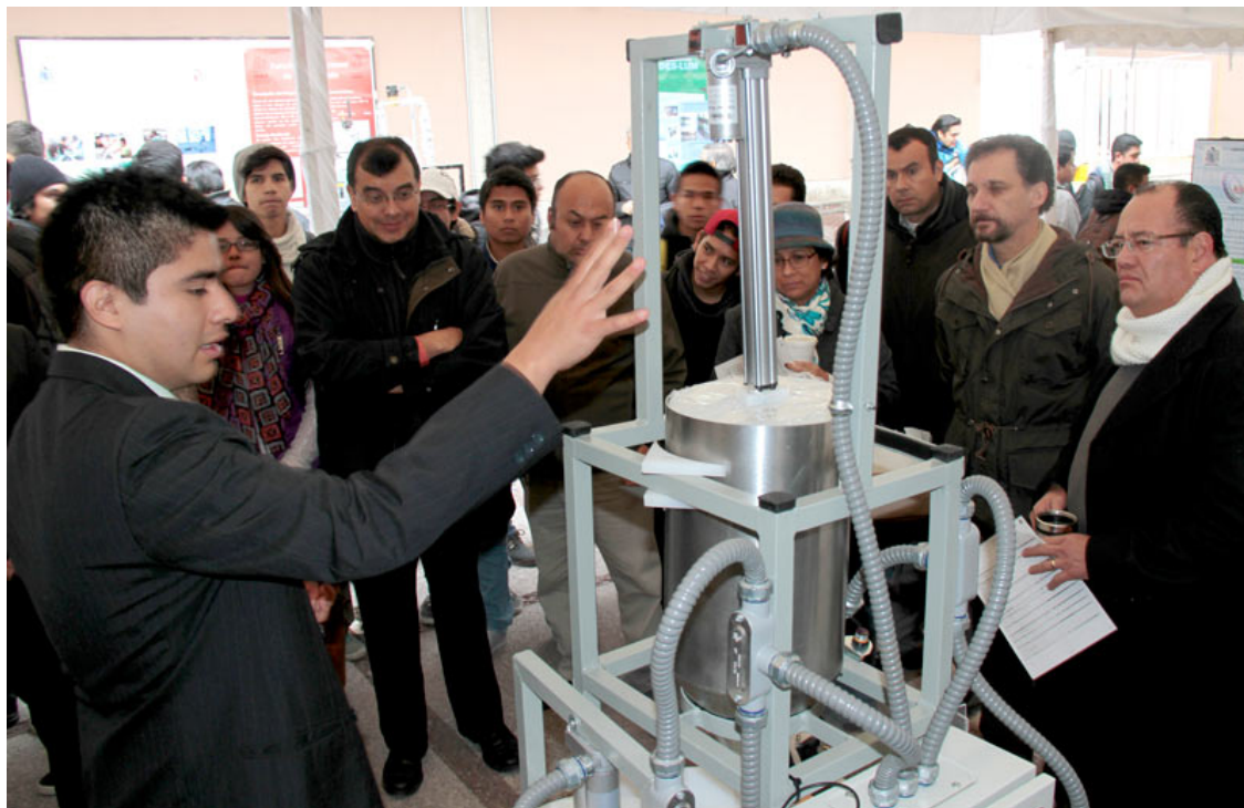
Figura 3. Exposición de proyectos integradores

Adicionalmente se realizan mediciones del logro de los resultados de aprendizaje de los estudiantes en base a la clasificación definida por ABET. De esta clasificación, los resultados b, c, y e son los que permiten conocer el grado de aplicación de las habilidades de pensamiento de orden superior. La medición se realiza en base a la observación de los estudiantes en varios grupos, en base a una escala de 1 a 4, y no incide en su calificación. En la Tabla 1 se muestran los resultados obtenidos; se puede observar que el valor de los resultados en general está cercano a 3.