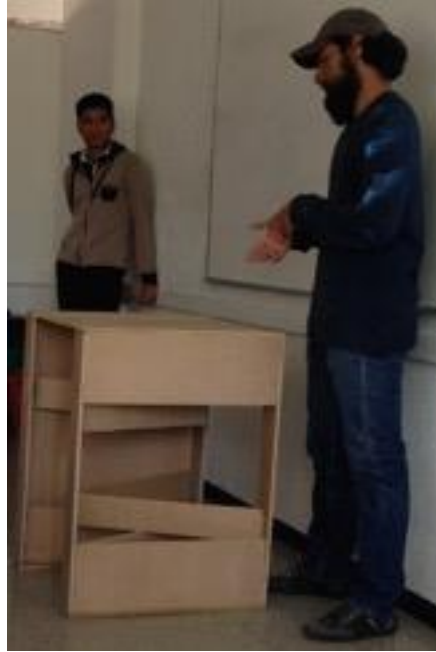
Figura 4. Prototipo de mesa plegable

debe mejorarse ya que no fue posible eliminar por completo el detergente, lo que generó aumento en la espuma y generación de malos olores.