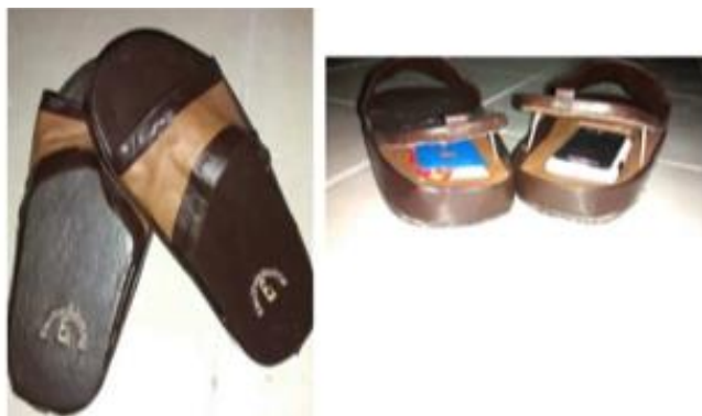
Figura 2. Bordado del prototipo con el nombre del equipo

1. Estación de carga: corresponde a una columna con espacios para publicidad y para información sobre procesos de generación de energía, por una parte, tiene una celda solar y por la otra una celda microbiana, el usuario podrá elegir la forma de recargar su batería y comparar la eficiencia de cada proceso. Estudiantes de nuevo ingreso presenciaron el funcionamiento de la estación y se pudo demostrar la generación de energía usando un multímetro. Se desarrolló durante el trimestre 14I.