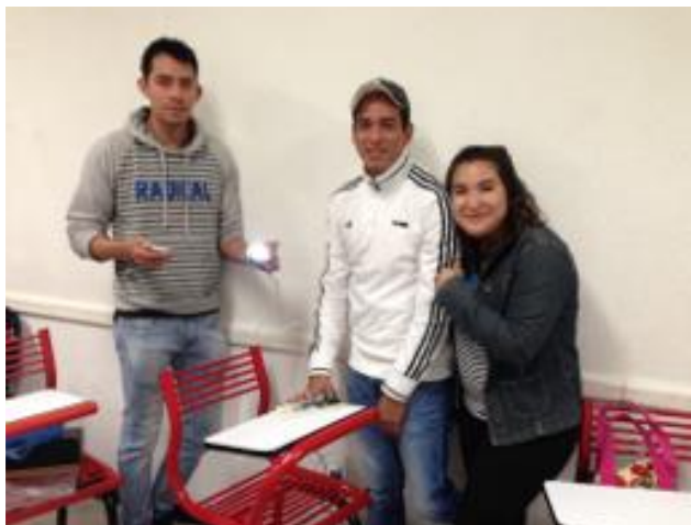
Figura 3. Prototipo de una lámpara automática.

4. Luz automática (Figura 3), trimestre 14P, la lámpara de led, se modula, enciende y apaga mediante una aplicación desarrollada por el equipo proponente.