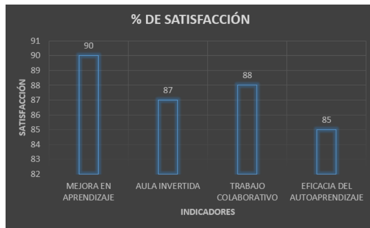
Figura 3. Porcentajes de satisfacción de los estudiantes con el aprendizaje activo

La sinergia productiva que se generó con el trabajo colaborativo se ve reflejada en el porcentaje de satisfacción del 88%. Cabe recordar que, la mayor parte de las actividades de la asignatura se trabajaron colaborativamente, a excepción de los ejercicios resueltos y los exámenes escritos.