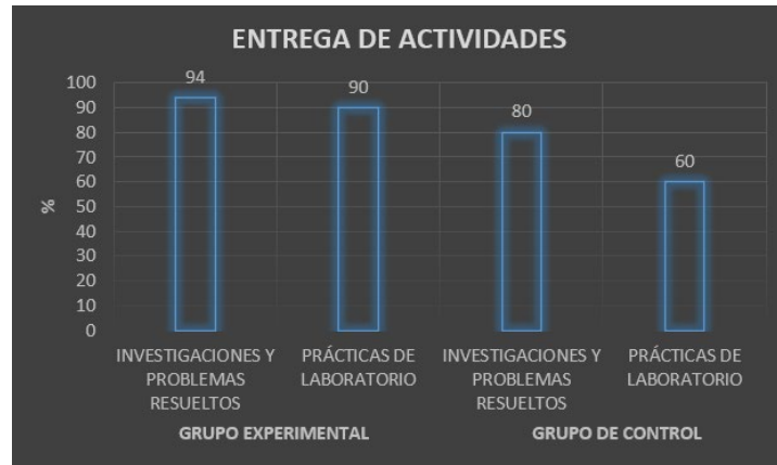
Figura 1. Porcentajes de entrega de actividades y prácticas de laboratorio

Cabe mencionar que, el grupo de control se trató con una metodología de enseñanza aprendizaje tradicional o pasiva, donde el profesor desarrolló los temas en el salón de clase, proporcionó la guía de las prácticas de laboratorio, qué y cómo debían hacerse, y los estudiantes realizaron las actividades fuera del aula. Al respecto Ghilay y Ghilay (2015, p. 10) establecen que, “cuando se administran las lecciones basadas en la transferencia de información, se convierte a los estudiantes en oyentes pasivos, que no participan en la lección”.